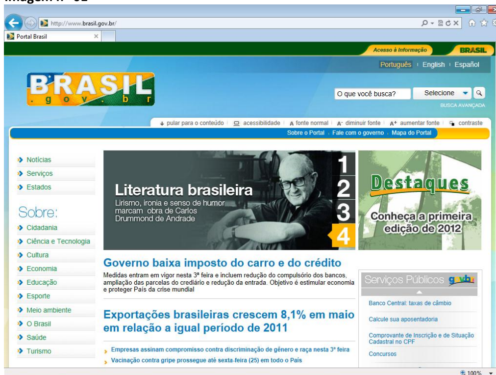
Imagem nº 01